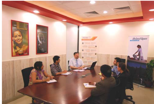
> Salle de réunion