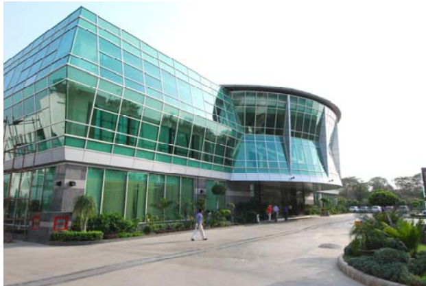
> Entrée principale

un cadre privilégié pour votre développement commercial